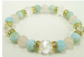
▲ラリマー×ローズクォーツ×水晶

デザインからお選びいただきお客様の腕周りに合わせることも、お好みの石で、オリジナルブレスレットを作成することもできます。